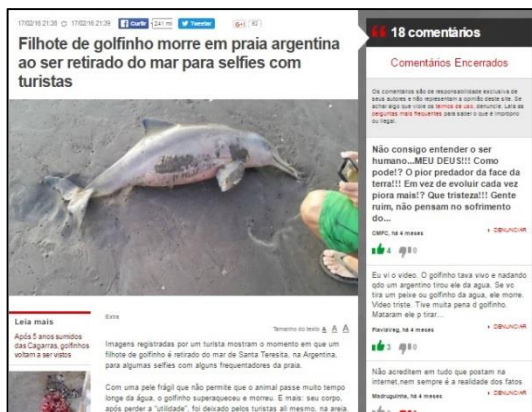
Imagem 3 – Matéria do Jornal Extra