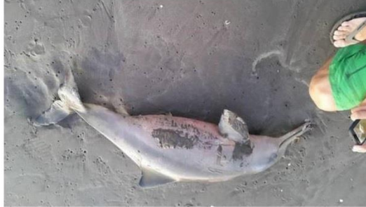
En Santa Teresita hubo polémica porque investigan si murió porque lo sacaron del agua.

Sigue la polémica Un turista registró el momento en que un hombre saca el animal del mar. Todavía no está claro si el cetáceo estaba vivo o muerto antes de que lo extrajeran del agua.