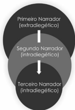
Gráfico 1 – disputa de vozes no âmbito do dispositivo

Os gráficos abaixo ajudam-nos a compreender, em primeiro lugar, como se dão os diálogos, e as decorrentes gerações de sentido, no âmbito do dispositivo; intramediáticos, portanto. Por os mesmos terem sido utilizados em outros momentos de nossa pesquisa (AUTOR, 2015, 2015-a, 2016), não nos demoraremos muito em sua análise, muito embora sua explicitação seja necessária ao propósito que almejamos, qual seja, compreender o quarto narrador na perspectiva da circulação midiática.