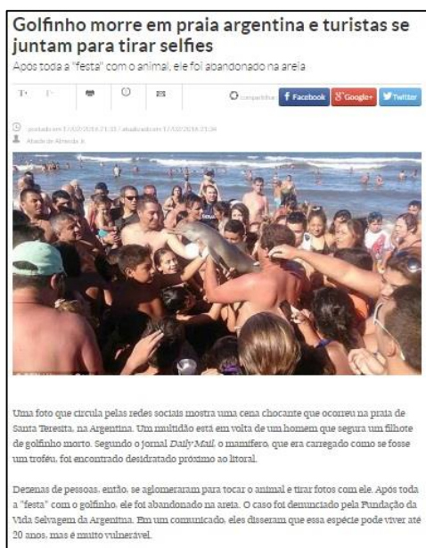
Imagem 2 – Matéria do Correio Braziliense

O título do Extra, por sua vez, afirma categoricamente que o golfinho morreu após ser retirado da água pelos banhistas, como observamos na imagem abaixo.