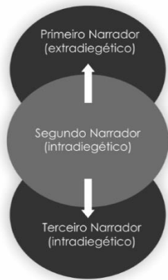
Gráfico 2 – processualidades diferenciadas